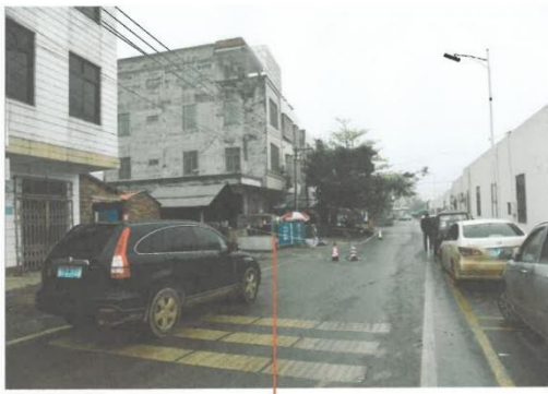
现场位于广东省徐闻县曲界镇光明路蔡胜在建楼房