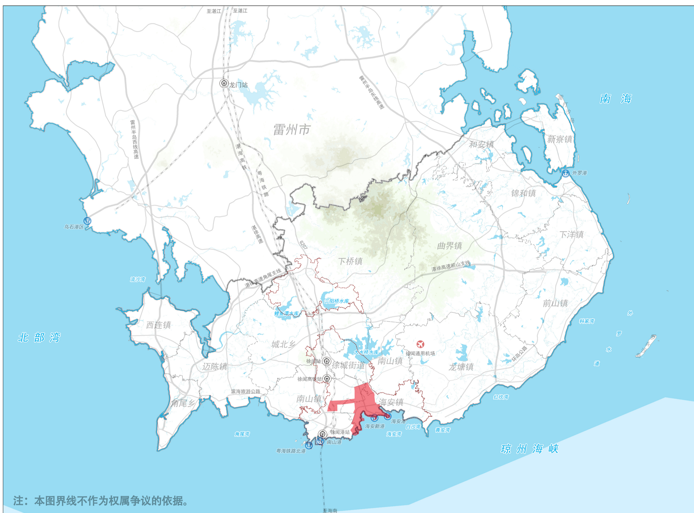
海安滨海新城组团在徐闻县中心城区的区位