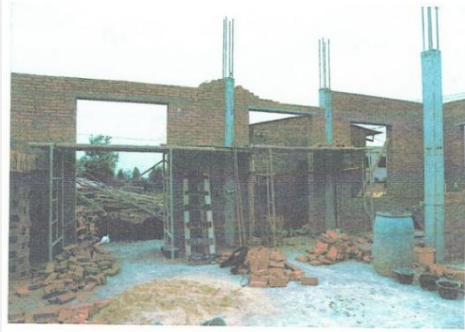
南围墙北侧依靠墙体搭建有工作架