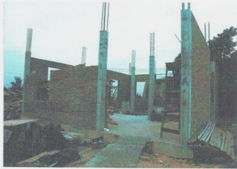
由该门进入中心现场