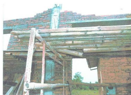
竹排由北往南第10根竹子呈断开状