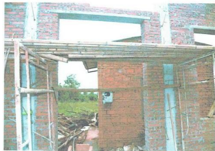
断开的竹子由东往西0.60米处为断开处