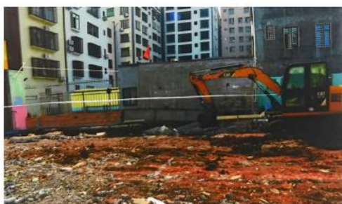
宅基地概貌及挖掘机

根据公安现场勘查：宅基地中部停放有一辆农用拉土车，农用拉土车的西边停放有一台挖掘机，该挖掘机挖斗距离西侧倒塌原围墙 1.02 米。在该挖土机南侧挖有一条长度为 7.9 米、宽度为 1.5 米、深度为 1 米的地基沟槽。地基沟槽西侧边缘围墙向东倒塌在地基沟槽内，该倒塌的围墙埋深为 0.36 米。在地基沟槽内有一把竹柄铁铲和倒塌围墙砖块，在倒塌围墙砖块上可见有血迹，该血迹距离西边倒塌原围墙 1.1 米，距离北边停放的挖土机挖斗 5.5 米。